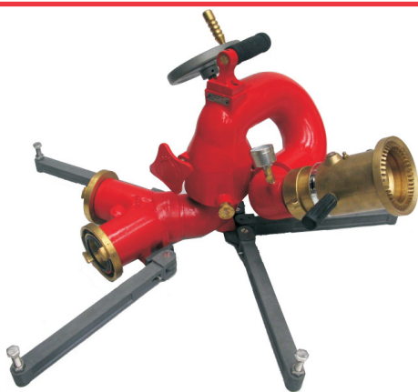
Esguicho fornecido separadamente

Canhão Monitor GMP-622-A , desenvolvido para atuar na configuração portátil ou fixo. Fabricado em alumínio anodizado, garantindo seu baixo peso e alta resistência. Projetado para vazões de até 1.250 GPM quando acoplado na base flangeada (acessório opcional).